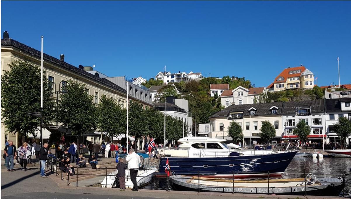
Høststemning i Pollen i Arendal.