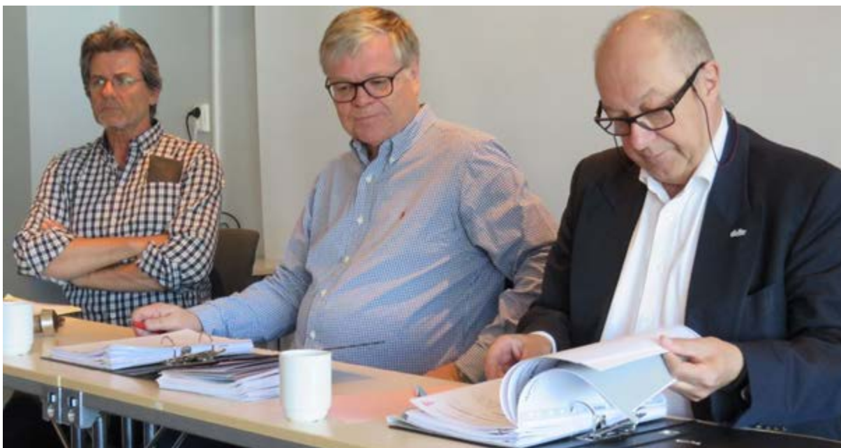
Fra landsmøte 2017